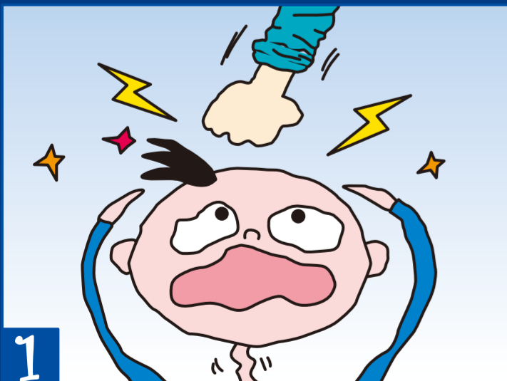
1 きょうも また、 あのこは コツンと なぐられた。