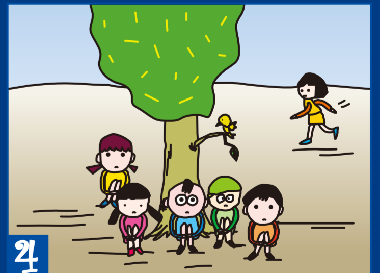
4 ひとりずつ、ひとりずつ、気がついた。 いっしょに いて あげられる ことを。